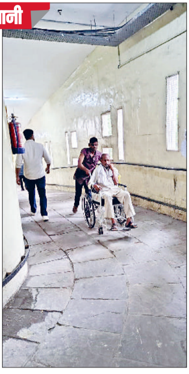
घक्का मारने पर मजबूर