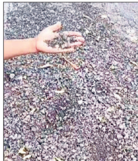
गन्नौर। शेखपुरा से पुरखास रोड की उखड़ी हुई बजरी दिखाते ग्रामीण।

शेखपुरा से पुरखास तक निर्माणाधीन सड़क कुछ ही महीनों में टूटनी शुरू हो गई है। सड़क पर जगह-जगह बजरी उखड़नी शुरू हो गई है। जिससे वाहनों का चलना मुश्किल हो गया है। ग्रामीणों का कहना है कि सड़क के निर्माण के दौरान पीडल्यूडी अधिकारियों द्वारा कोई ध्यान नहीं दिया गया। जिससे बारिश के मौसम में सड़क खराब हो गई है। स्कूली बच्चों और दोपहिया वाहन चालकों को सबसे अधिक परेशानी का सामना करना पड़ रहा है। गांव के लोगों ने संबंधित विभाग से सड़क निर्माण की जांच कर उसे ठीक ढंग से बनवाने की मांग की है। उनका कहना है कि यदि जल्द सुधार नहीं किया गया तो वे सीएम विंडो पर शिकायत करेंगे। वहीं