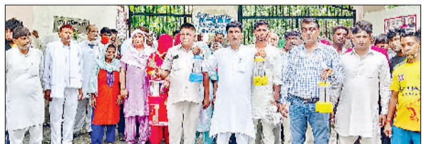
सोनीपत। लघु सचिवालय के बाहर लालटेन लेकर शोष प्रकट करते हुए प्रदर्शनकारी।

घर का सारा सामान जल गया। घर में कमरों के अंदर रखा सामान व दरवाजे तक आग में जल गए। पीड़ित ने बताया बिजली विभाग की तरफ से उसके घर के छज्जे से कई तारों को बांध रखा है। जिसके चलते करंट उसके घर में आ रहा है। रविवार रात को करीब 12 बजे अचानक आग लग गया।