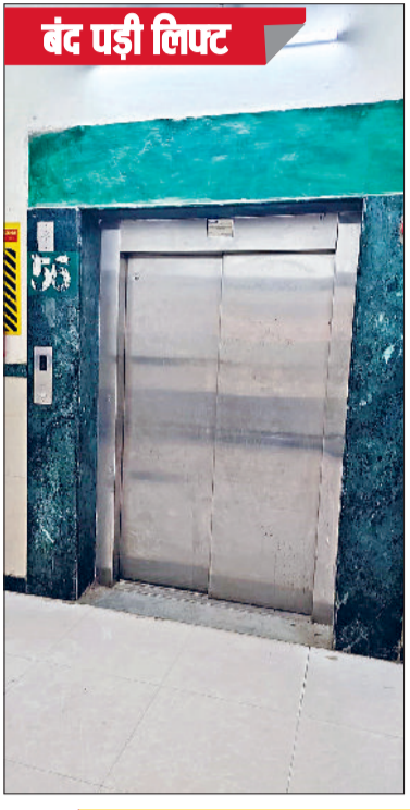
बंद पड़ी लिफ्ट

नागरिक अस्पताल में करीब एक सप्ताह से लिफ्ट खराब है। लिफ्ट का पार्ट खराब होने के चलते मरीजों और गर्भवती महिलाओं को भारी परेशानी का सामना करना पड़ रहा है। मरीजों को रैप से ढील चेयर पर ले जाना पड़ रहा है, जो उनके लिए काफी मुश्किल हो रहा है। परिजनों को रैप से धक्के मारने पर मजबूर होना पड़ रहा है। जानकारी मिली है कि लिफ्ट का कार्ड खराब हो गया है। इस संबंध में देख रेख करने वाली कंपनी को अवगत करवाया गया है। बता दें कि नागरिक अस्पताल में पहली व दूसरी मंजिल पर जाने के लिए एक लिफ्ट, रैप व सीढ़ियां हैं। गंभीर रूप से बीमार मरीजों को ओपीडी में दिखाने के बाद उन्हें वार्ड में शिफ्ट किया जाता है। वहीं महिलाओं को डिलीवरी के बाद जच्चा-बच्चा को प्रथम तल पर स्थित वार्ड में भर्ती रखा जाता है। प्रथम तल पर जाने के लिए महिलाओं को लिफ्ट खराब होने के चलते रैप से ढीलचेयर को धक्का मारकर लेकर जाना पड़ता है। जिससे मरीजों व उनके परिजनों को परेशानी का सामना करने पर मजबूर होना पड़ रहा है। लिफ्ट कई दिनों से खराब पड़ी है।