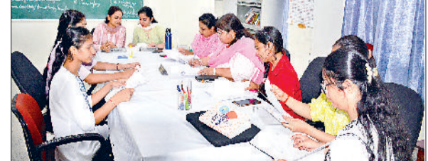
गोहाना। दाखिला प्रक्रिया में भाग लेते हुए छात्राएं।