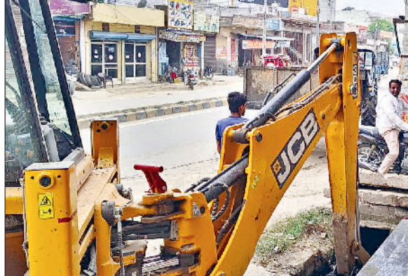
गन्नौर। जैसीबी से नालों पर रखे स्लैब हटाकर नालों की सफाई करते सफाई कर्मचारी।