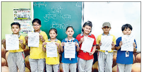
गन्नौर। प्रतियोगिता के दौरान छात्र अपना सुलेख दिखाते हुए।