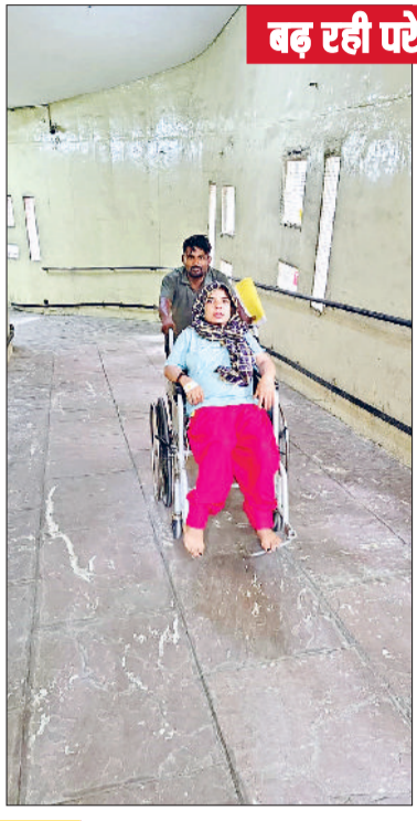
बढ़ रही परेशानी