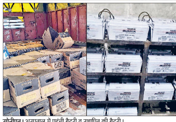
सोनीपत। अस्पताल में पहुंची बैटरी व स्थापित की बैटरी।