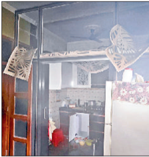
सोनीपत। घर में अलग-अलग हिस्सों में जला हुआ सामान।