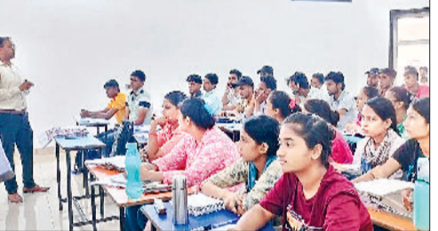
सोनीपत। कार्यक्रम के दौरान विद्यार्थियों के साथ वक्तवगण।