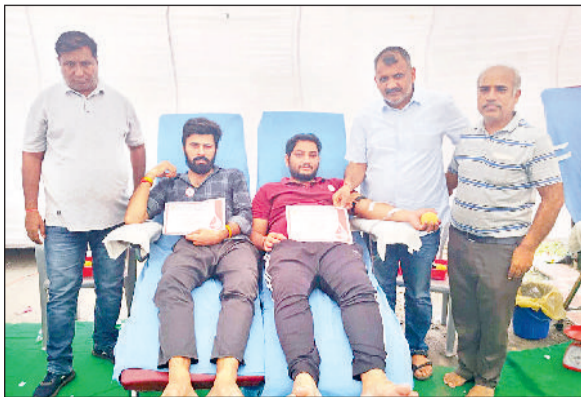
गोहाना। शिविर में रक्तदाताओं को आशीर्वाद देते हुए अतिथि एवं आयोजक।

■ भागराम ट्रस्ट के साप्ताहिक शिविर में 1 महिला समेत 37 लोगों ने बटोरा रक्तदान का पुण्य