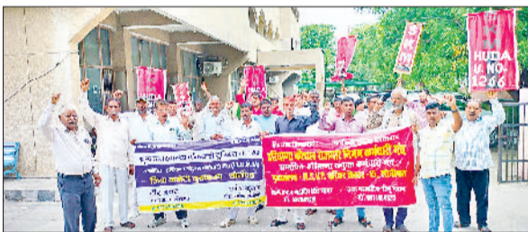
सोनीपत। एचएसवीपी कार्यालय के बाहर धरना देते हुए कर्मचारी।