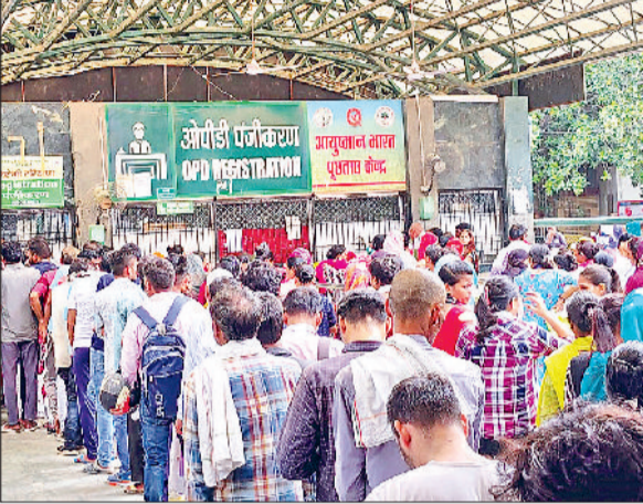
सोनीपत। रजिस्ट्रेशन काउंटर के बाहर जमा भीड़।

बता दें कि नागरिक अस्पताल सोनीपत में दो सौ बेड की सुविधा मौजूदा समय में उपलब्ध है। वहीं