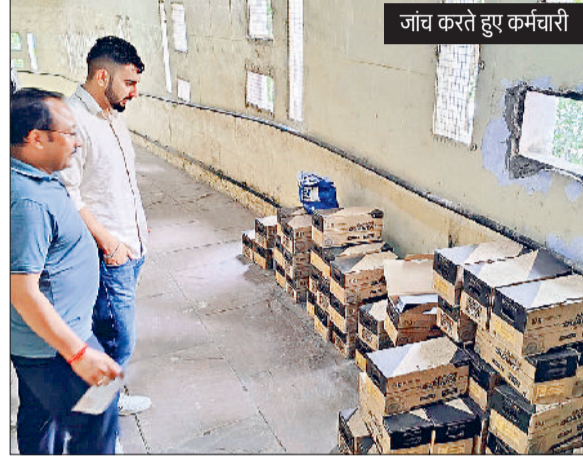
जांच करते हुए कर्मचारी

अस्पताल में इस समय हर रोज दो हजार से ज्यादा की ओपीडी रजिस्ट्रेशन मरीजों का होता है। मौसम की मार व बीमारियों के चलते अस्पताल में मरीजों की भीड़ देखने को मिल रही है। नागरिक अस्पताल सोनीपत व प्राथमिक स्वास्थ्य केंद्र मुखल में विभाग की तरफ से मरीजों को सहूलियत देने के लिए ऑनलाइन प्रणाली का इस्तेमाल किया जाता है। अस्पताल में लगभग 80