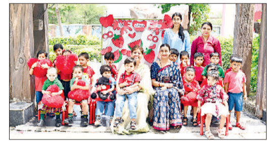
सोनीपत। ब्राइट स्कॉलर स्कूल में विद्यार्थियों के साथ प्राचार्य एवं अन्य।